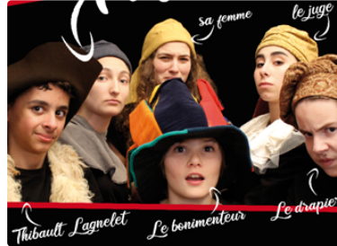
La Boîte à Jouer part en balade

En attendant le prochain festival, cet été