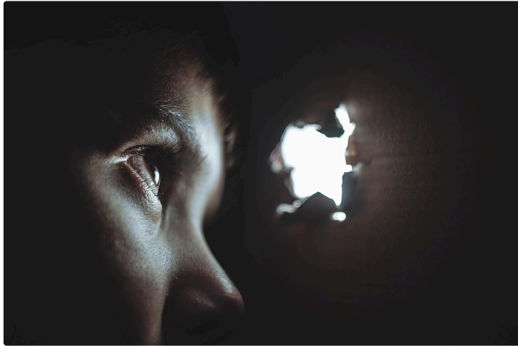
« Familles Inces-tueuses » de Séverine Mayer