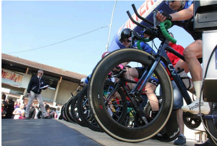
Chrono 47 : les Bretons surclassent leurs adversaires

Hommes et femmes, ils ont été les meilleurs !