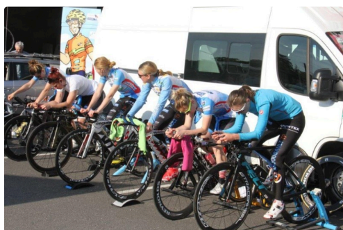
Mise en jambes avant le départ.