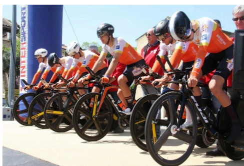
Attention au top du chrono !