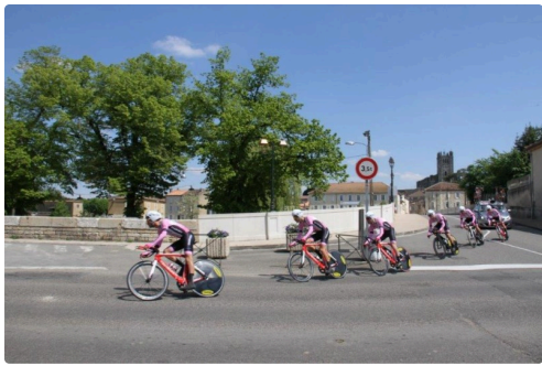
Chrono 47 IMG_0333.jpg