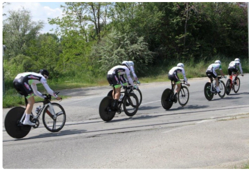
Sur cette photo, on croit reconnaître l'équipe bretonne du Team Pays de Dinan