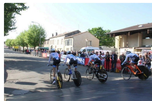
Les coureurs s'élançant sous les applaudissements du public mais aussi de Monsieur le Maire