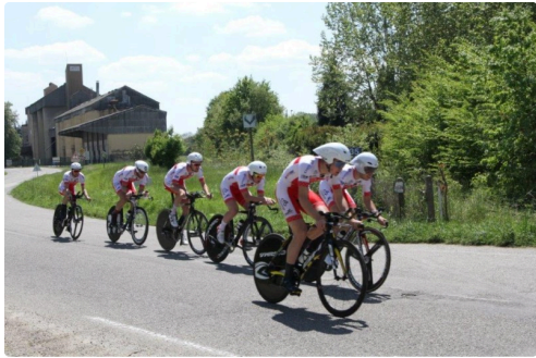
Chrono 47 IMGL5819.jpg