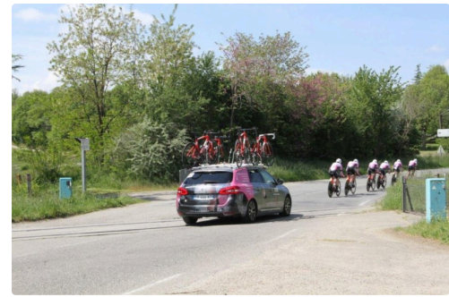
Une voiture suiveuse par équipes.