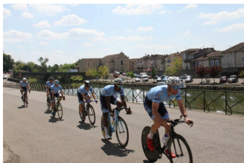
Chrono 47 IMG_0302.jpg