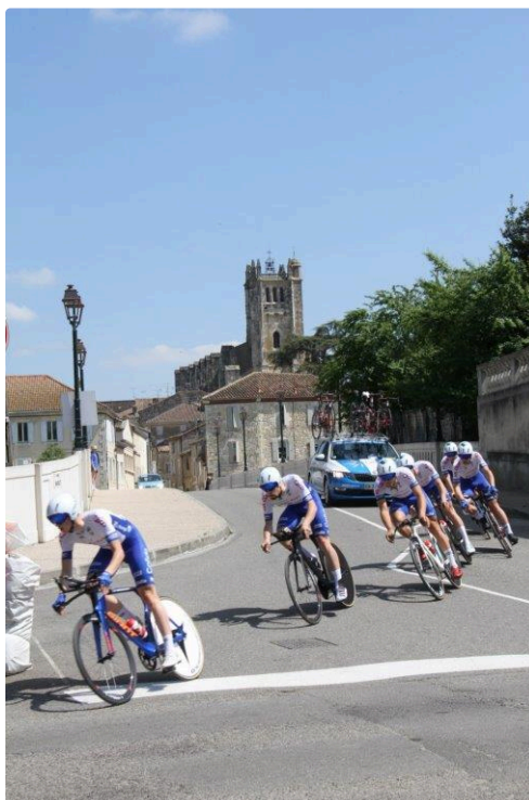
Chrono 47 IMG_0326.jpg