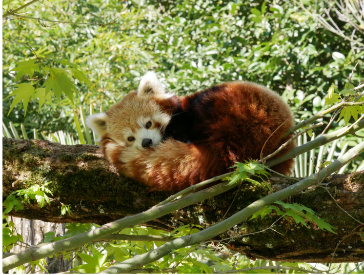
Le Parc animalier des Pyrénées célèbre ses 20 ans !