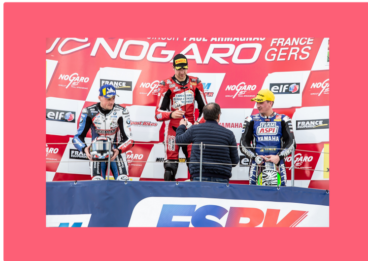
Superbes empoignades au Championnat Superbike à Nogaro

Samedi 4 mai, il n'y avait que deux courses pour la manche nogarolienne (la 2ème après Le Mans) du Championnat de France Superbike (le FSBK) Le reste de la journée était occupé par les essais. C'est tant mieux, car il y avait quelques gouttes de pluie l'après-midi, qui auraient pu inciter les teams à des choix de pneus ne convenant pas aux dix courses du dimanche 5 mai, qui a été une très belle journée ensoleillée, quoique il ait fait un vent froid. D'ailleurs, le public est venu en nombre le dimanche : il y a eu 12.478 spectateurs, soit 33 % de plus qu'en 2018.