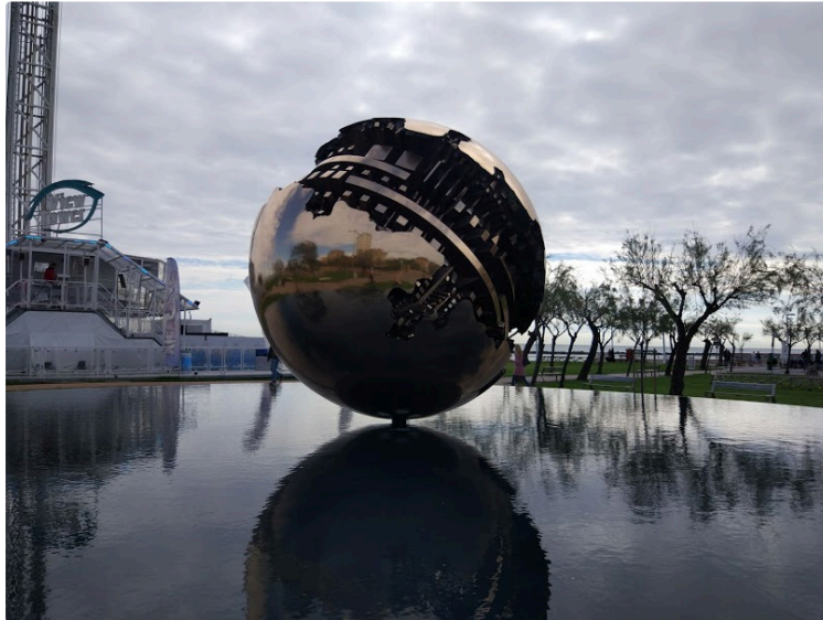
Voyage du Comité de Jumelage Castin Duran Ruda dans les Marches et l'Emilie-Romagne

Photo : "la Grande Sfera" de Arnaldo Pomodoro, sculpteur sur bronze, mondialement reconnu