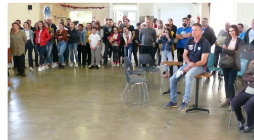
Les supporters étaient venus nombreux.