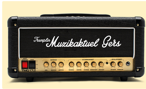
Deuxième soirée Tremplin Muzikaktuel Gers 2019

Vendredi 17 mai, à 21h, deuxième soirée du Tremplin Muzikaktuel Gers 2019 (gratuit) avec DSK Princess [rock fusion], From Dusk To Dawn [metal mélodique] et Supremacy [groove metal]