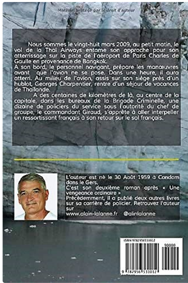
4eme couverture (2).jpg