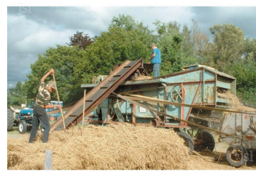
Une batteuse en action

Quand on sortait, le village de Courrençan commençait à paraître dans l'aube.