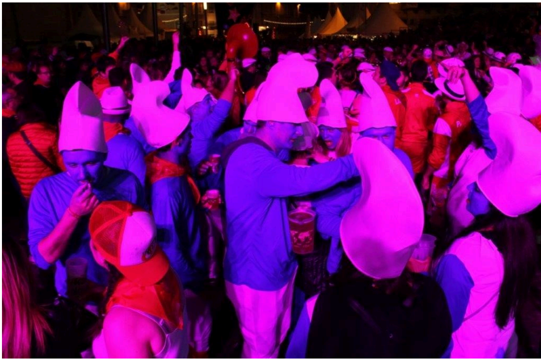
Alors on danse...