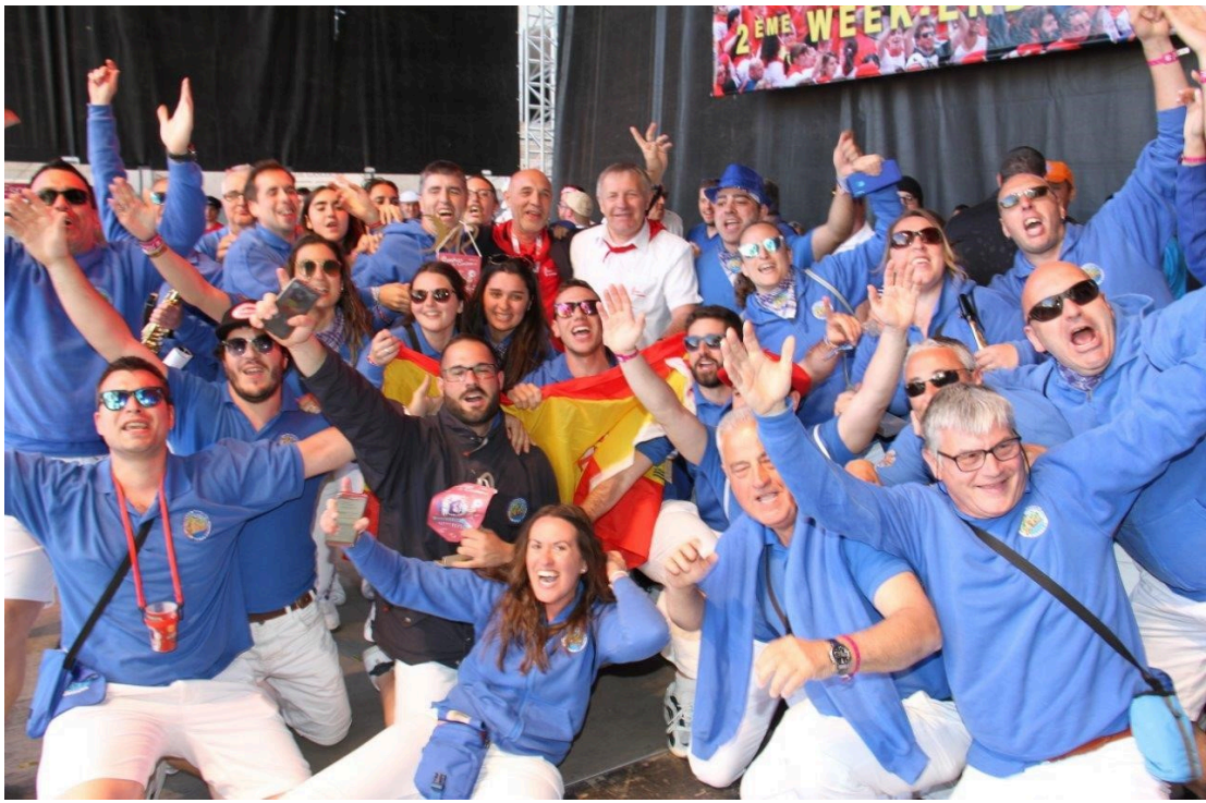
Palme d'or pour Los Ronceros