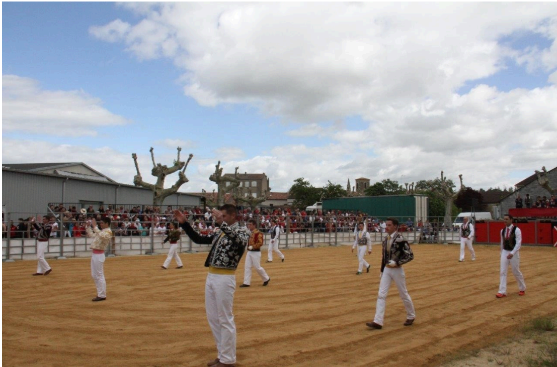
Course landaise le matin