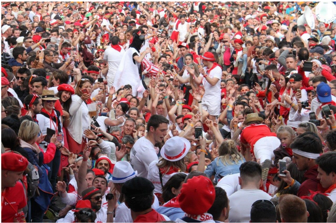
Paquito par là