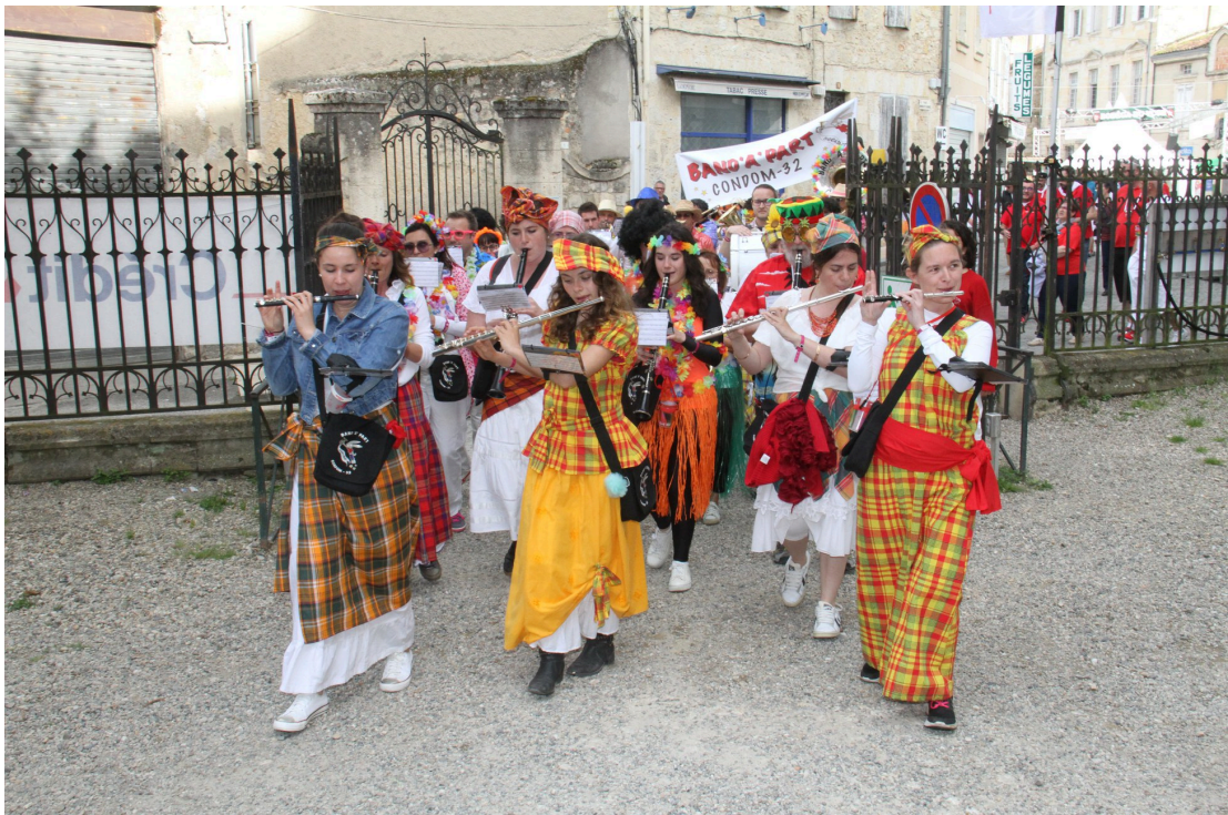
La Band'A' Part, très colorée