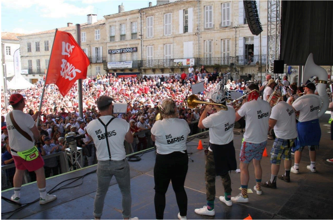
Argent pour Los Barlos