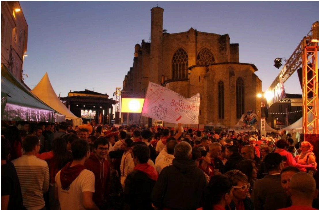
A la nuit tombée...