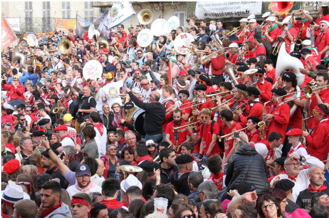
En route pour la folie !