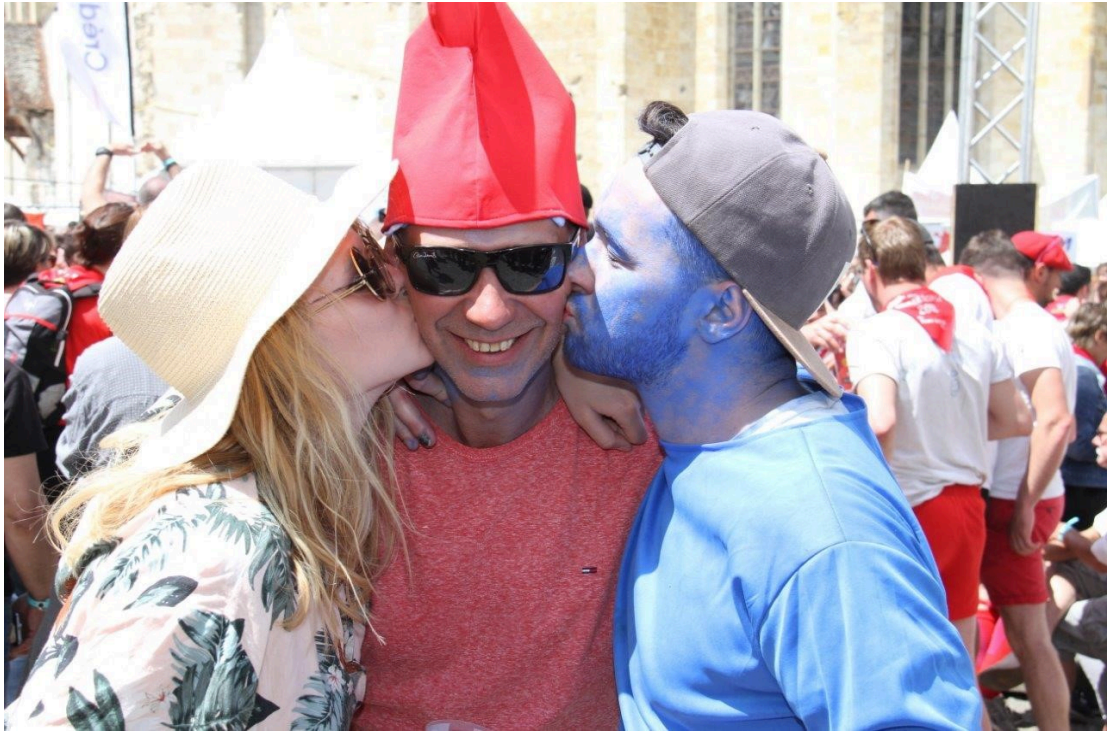
Petit bisou par ci