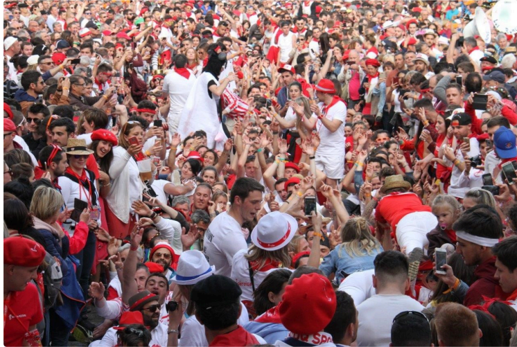
Les Bandas comme si vous y étiez !

Marc Le Saux, notre photographe, était au milieu de la foule, pour sa plus grande joie, et a pu saisir tous les moments importants qui ont jalonné ces trois journées du Festival de Bandas 2019, derrière son objectif.