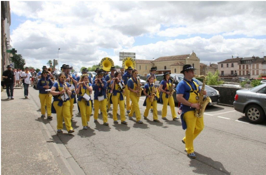
C'est parti !