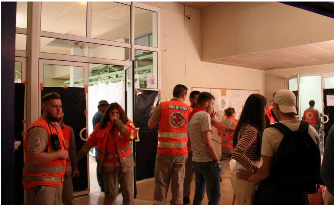
Merci à ceux qui ont veillé sur les petits soucis