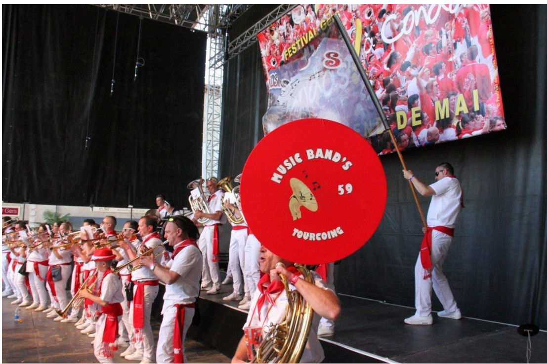
Bronze pour Music Band's 59