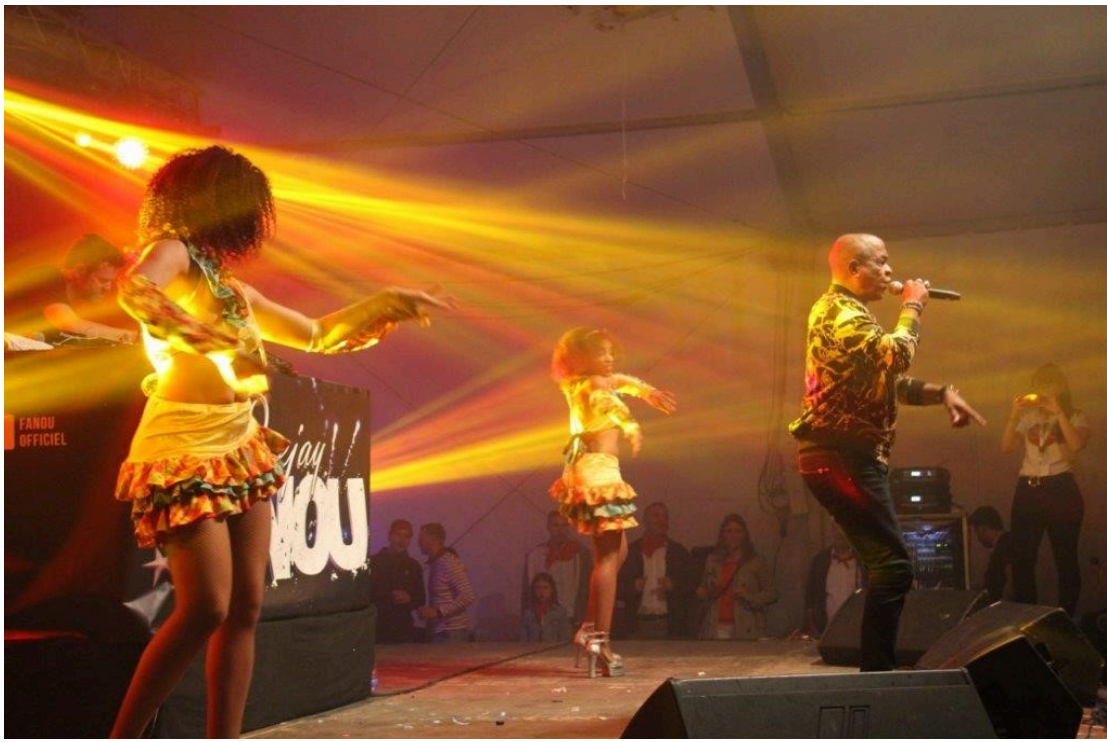
Il fait chaud hein avec Franky Vincent et ses choristes ?...