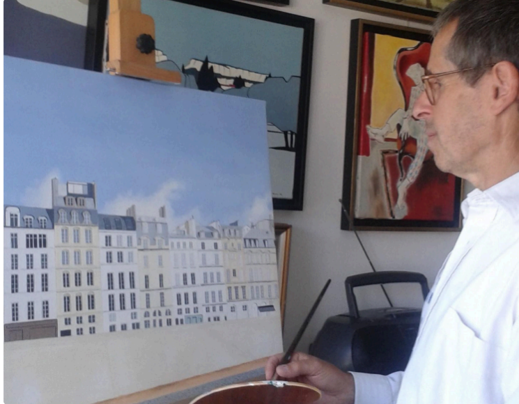
La Cimaise Armagnacaise

Une nouvelle association pour animer le village