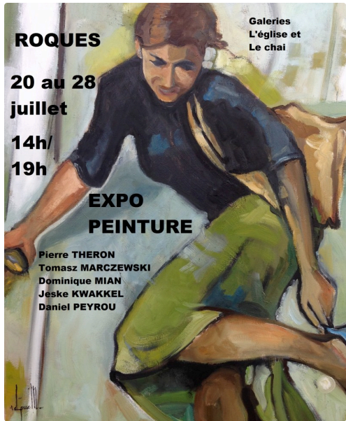
Affiche expo peinture ROQUES 20 au 28 juillet 2019.jpg