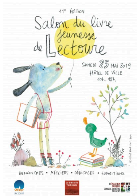
Illustration de Une : Pixabay.com