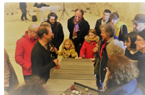
Le public intrigué par ces drôles d'instruments