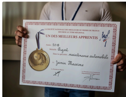
Gros plan sur le diplôme