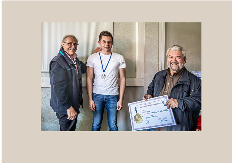
Les meilleurs apprentis de France sont au lycée de Nogaro

Six lycéens de terminale MVA à l'honneur