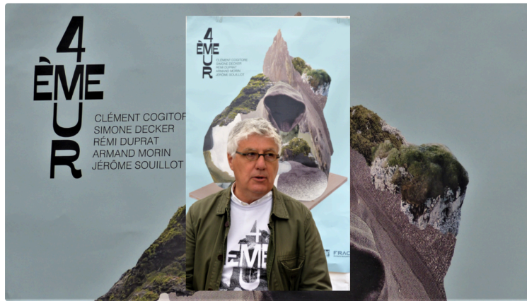
memento saison 4 : 4ème mur

" MEMENTO est un lieu singulier où se conjuguent les traces du passé et la création contemporaine. Cet ancien carmel, devenu archives départementales, se mue au fil des ans pour offrir aux visiteurs une expérience unique de découverte d'œuvres d'art au cœur d'une bâtisse hors du temps. Depuis trois ans maintenant cet écrin patrimonial devient, durant l'été, un terrain d'imagination et de création pour les artistes de la scène actuelle. Tout est parti d'une volonté de vivre l'exposition comme une aventure intime entre le lieu, les artistes et le public. Ce que nous voulons avant tout c'est défendre un endroit où les émotions des pratiques artistiques résonnent."