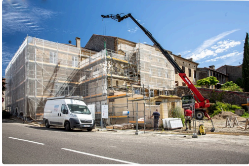
Le chantier vu du coin de la route d'Aire-sur-l'Adour