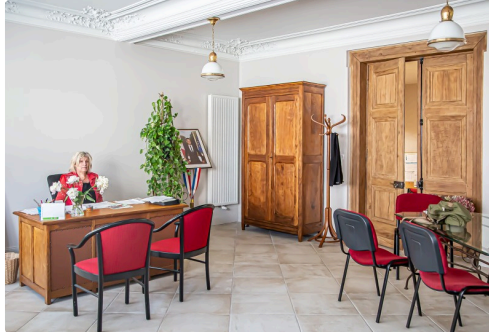
Bureau de la maire en cours d'installation