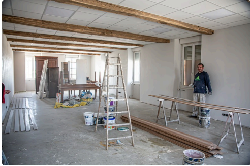
Une salle en plein aménagement