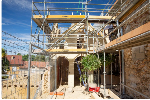
Le pigeonnier sur la terrasse opposée à la RD6 (rue principale)