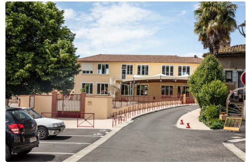
Les abords de l'école