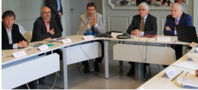
Charte départementale sur l'entretien des réseaux publics et la défense de la biodiversité.