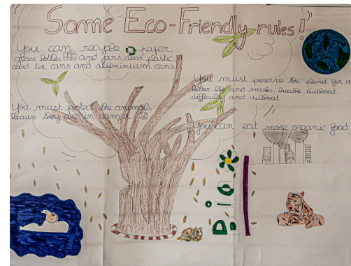
Hymne à l'écologie en anglais