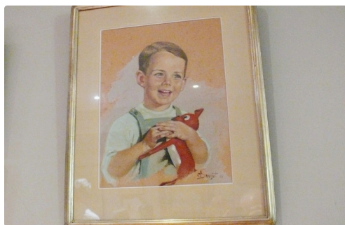
Le portrait de l'enfant qui a séduit Hergé.