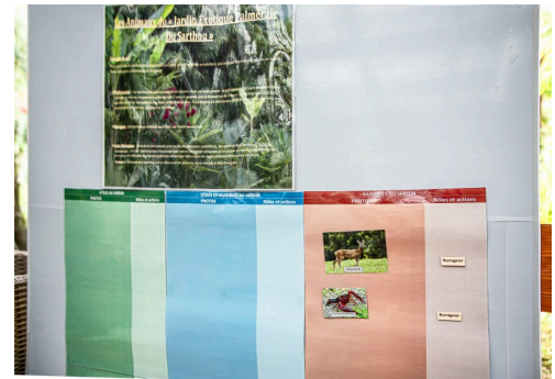
Quiz pour la reconnaissance et le classement des animaux sauvages du jardin