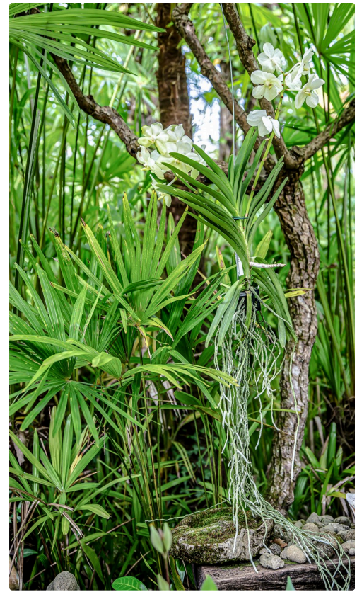
La même, des fleurs jusqu'aux racines