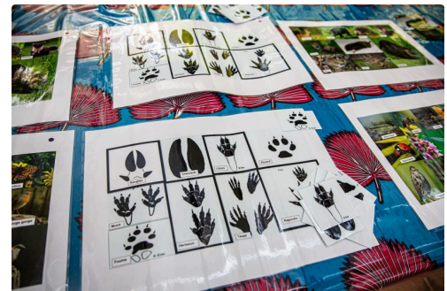
Photos des empreintes d'animaux