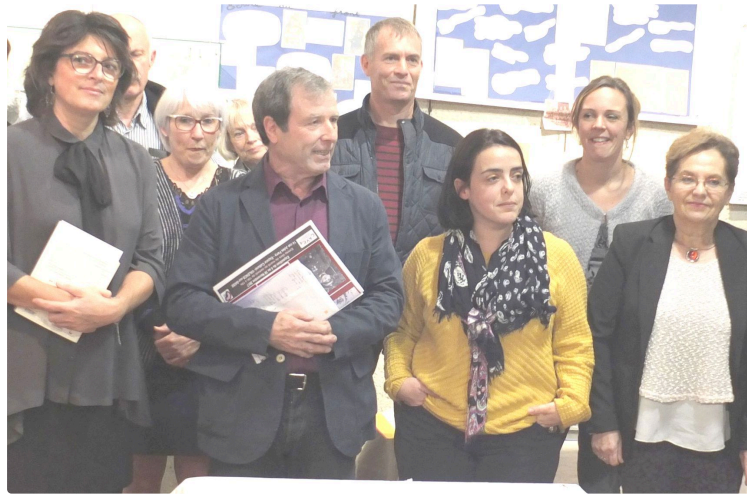
Des Gersois dans la grande guerre

Vernissage de l'exposition qui débute vendredi 7 juin à la Cavea