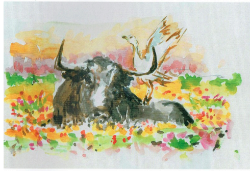
Toro au campo dans un champ de fleurs