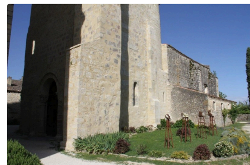
cda expo 2.jpg