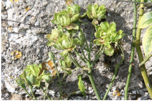
Les roses vertes de Larressingle