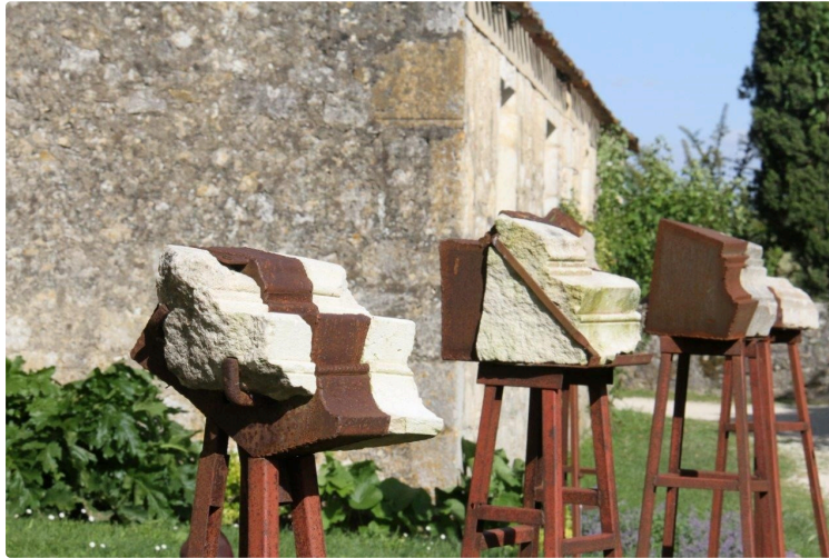
Patrimoine et art contemporain