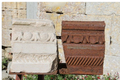
et ses oeuvres