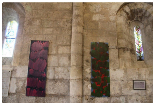
et ses oeuvres