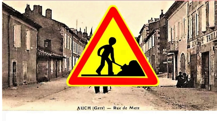
Aménagement de la rue de Metz.