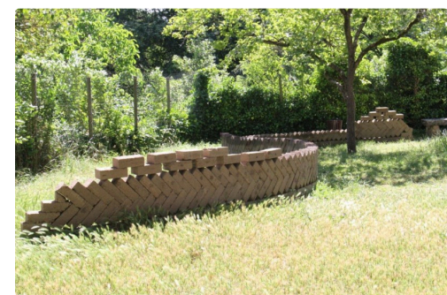
Condom Collectif Ethnographic