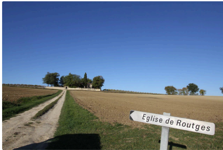
Fin de semaine sur les Chemins d'Art en Armagnac

Judi 13 juin , atelier d'écriture animé par Agathe Rivals, à l'église de Routgès, de 18 h 15 à 20 h 15.