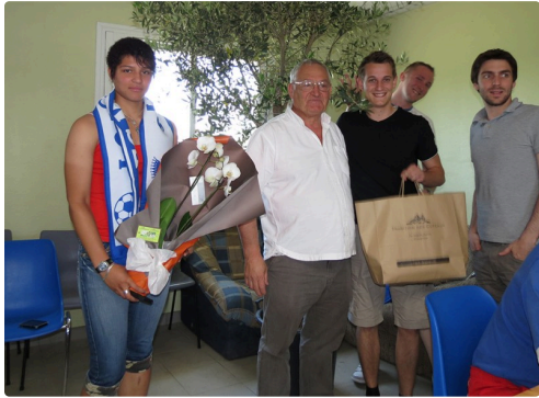
Avec l'ex-président Mendéz