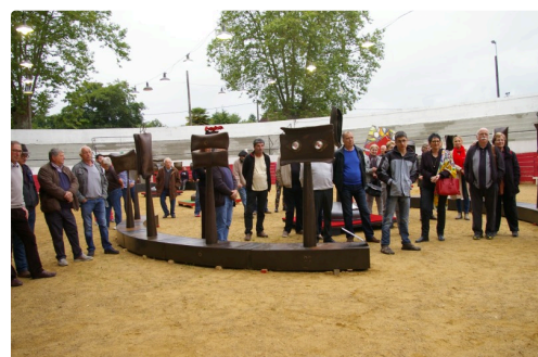
Public d'aficionados pour le vernissage