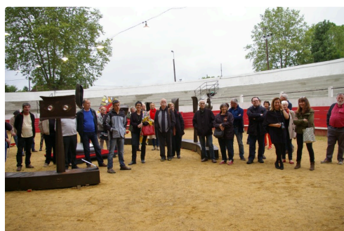
Beaucoup étaient venus des extérieurs à Plaisance