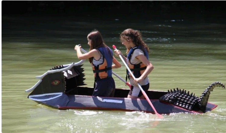
Ça patauge (toujours) à Gauge !

Cette année encore le Centre Social vous invite à "Ça Patauge à Gauge" le samedi 29 Juin de 12 h 30 à 17 h.