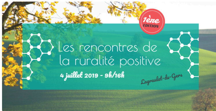
Rencontres au village de Lagraulet-du-Gers, exemple de réussite rurale

Le 4 juillet, à Lagraulet-du-Gers, au cœur de l'Armagnac-Ténaarèze, chercheurs, acteurs et élus locaux, agents de développement, responsables de ressources humaines, de chambres consulaires, entrepreneurs indépendants, candidats à l'installation, néo-ruraux convertis... vous êtes tous invités à réfléchir et à débattre sur les stratégies et les outils à mettre en place pour renforcer l'attractivité du Gers.