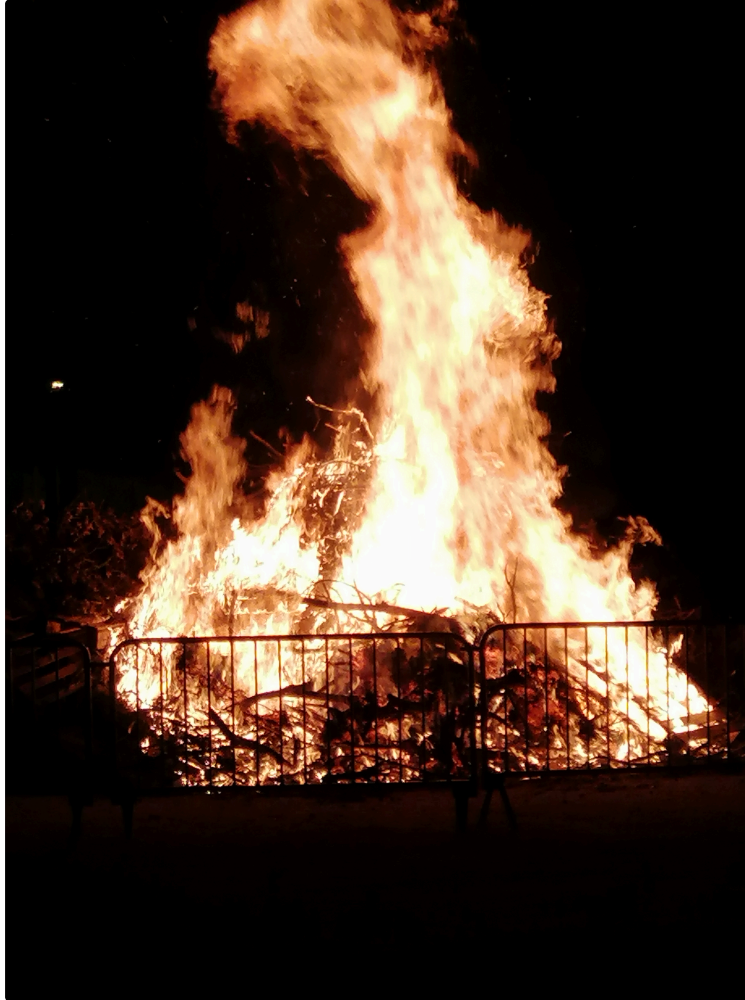
Le feu de la Saint-Jean brûle toujours, mais les traditions ont disparu

A Vic-Fezensac, sur la place du Foirail, il est allumé tous les ans par la doyenne du quartier et le maire.