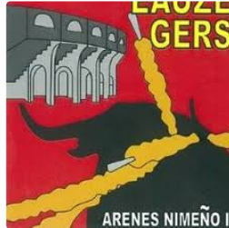
Places offertes pour le Trophée Occitanie lors de la feria

La Coordination des Clubs Taurins de Nîmes et du Gard organise le trophée Occitanie.