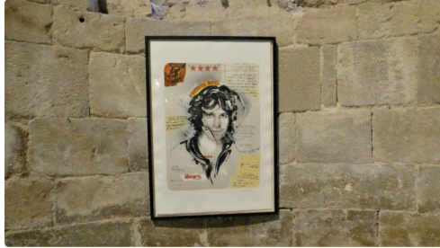
Jim Morrison le chanteur des Doors.