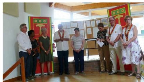
Les personnalités au moment des discours.