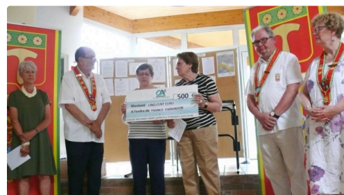
Un don de 500 euros pour France Parkinson.

(2) L'Association France Parkinson a été créée en 1984 et reconnue d'utilité publique en 1988, elle se donne pour buts de :