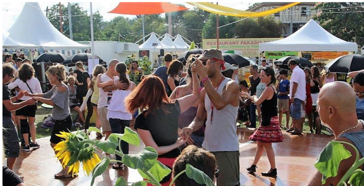
Tempo Latino - Le off à l'ombre des arènes