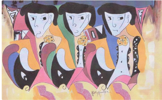
Novillada et corrida jouent la carte des toros du Gers, le 6 juillet