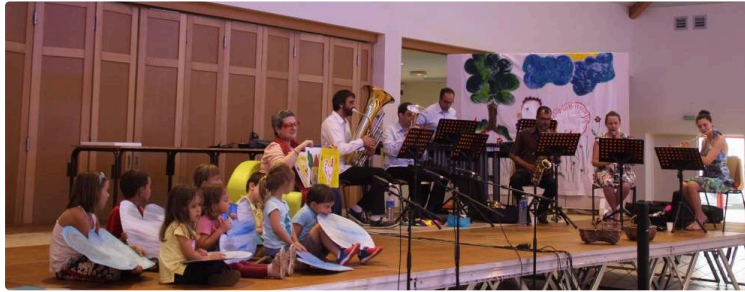
Le monde merveilleux de Coqueline

Mardi en fin d'après-midi, au Pôle culturel, le public a découvert le conte musical Coqueline.