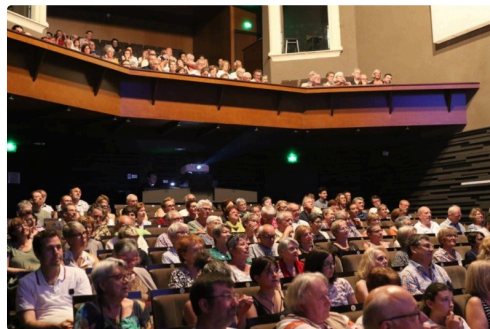
Carmes 3 juillet 2R6A7912 (2).jpg