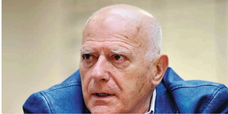
Le clin d'œil d'André Daguin

Tous les vendredis, vous avez rendez-vous avec André Daguin, figure emblématique des cultures et de la gastronomie gasconne. L'ancien chef étoilé, qui a rejoint le Cercle des Aficionados de PresseLib', prend sa plume pour vous.