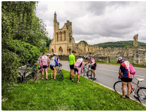
Devant l'abbaye de Byland en ruines