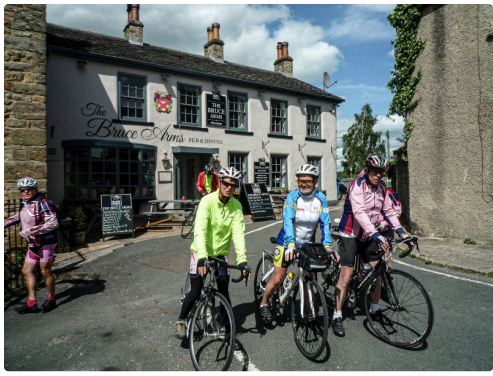
Devant le pub Bruce Arms dans York