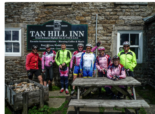
Le pub le plus élevé de Grande-Bretagne (600 m)