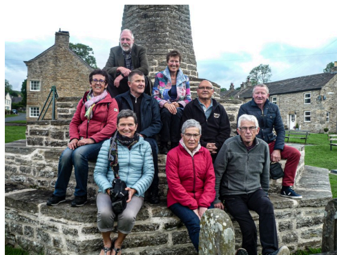
Vue typique du Yorkshire