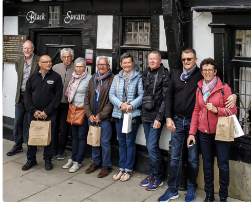
Gros plan devant le Black Swan