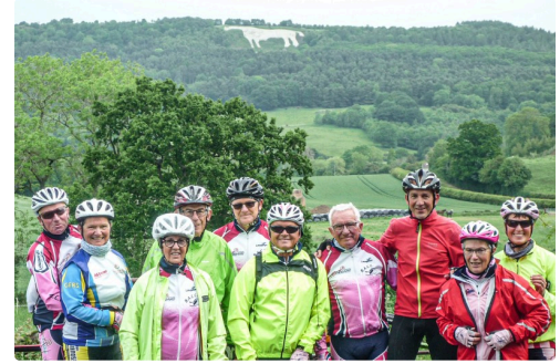
Le cheval blanc est une sculpture en calcaire dans le terrain calcaire