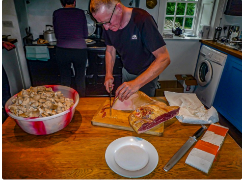
Mousserons et jambon