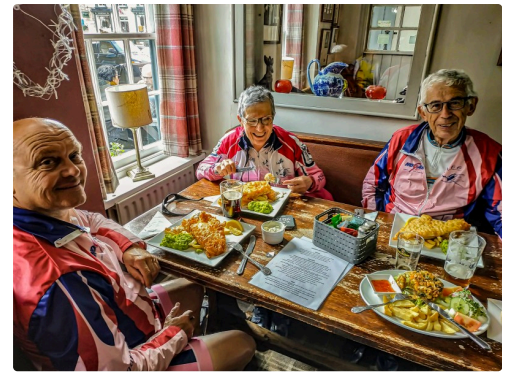
Fish and chips