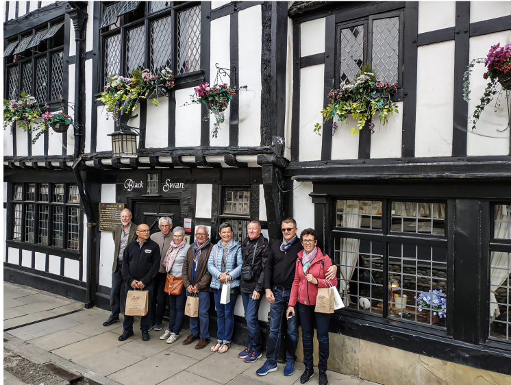
Les cyclos nogariens en Grande-Bretagne