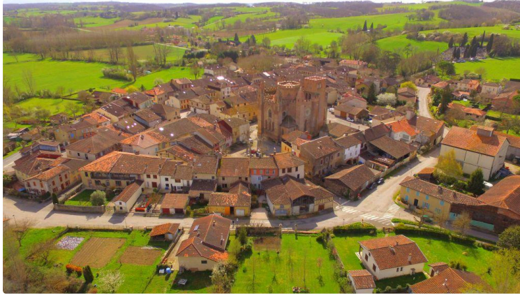
Festi'Drôle, c'est ce week-end !

Ne perdez plus de temps, foncez ! Le premier rendez-vous est à 15 h.