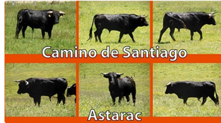
Novillada du 14 juillet