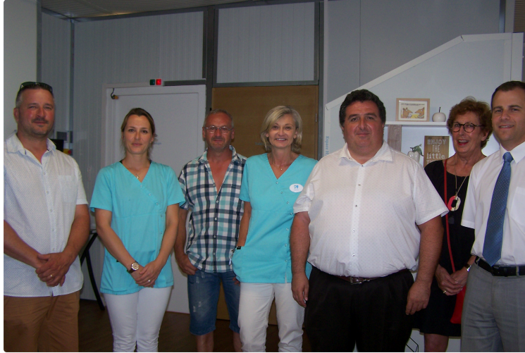
Inauguration du cabinet dentaire

Vendredi dernier, la mairie avait conviée les élus et les professionnels de santé du secteur de Saint-Clar à l'inauguration du nouveau cabinet dentaire que la mairie a construit en mars et avril 2019.