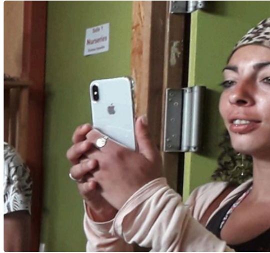
Gendarmerie Gers : Appel à témoins