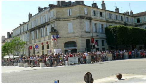
Des centaines de personnes étaient présentes à la cérémonie.