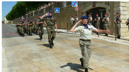
Défilé du détachement du 5ème régiment d'hélicoptère de combat.