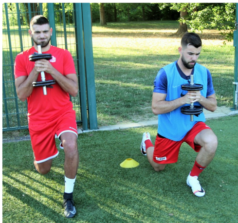
Musculation ! Même si les vacances ont été courtes, il faut se remettre dans le bain.