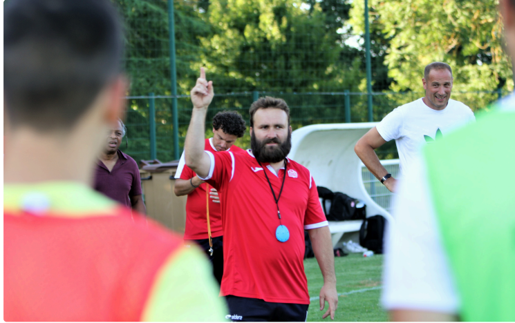
Auch Football : « On a la foi, l'envie... on peut renverser des montagnes »

Les Auscitains ont repris le chemin de l'entraînement lundi soir. Impatients de découvrir le niveau N3.