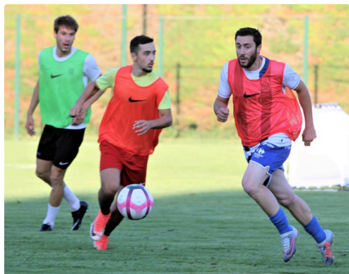
L'envie de toucher du ballon pour tous les joueurs...