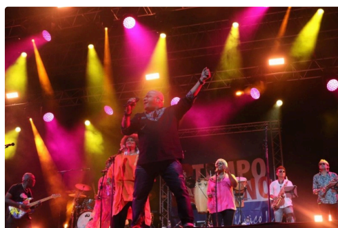
que voici !