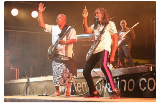
Vous êtes là ?...