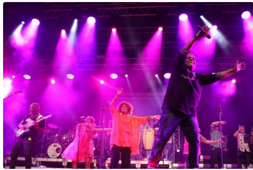
Tous ensemble !