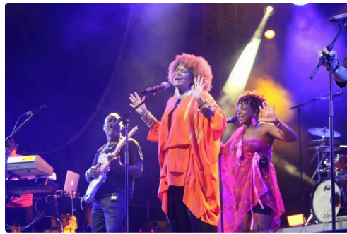
Une énergie XXL