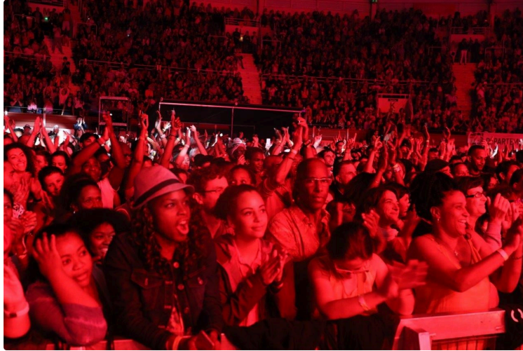
Kassav a enflammé cœurs et corps

Il fallait bien une soirée d'ouverture exceptionnelle à l'édition Tempo Latino 2019 pour regonfler le moral des troupes et réchauffer les festivaliers, dégoulinants non pas de sueur, mais de pluie.