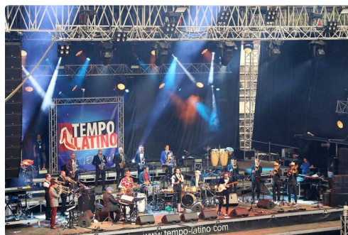
Bigre ! Ils sont tous là !