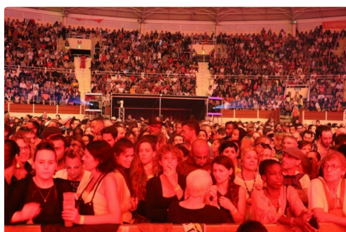
En attendant Kassav