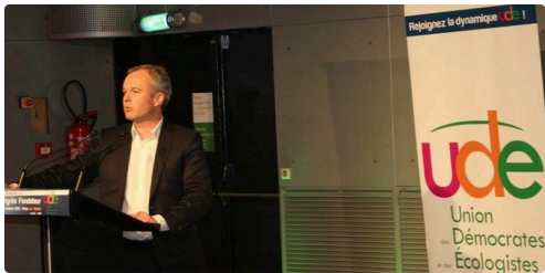
François DE RUGY