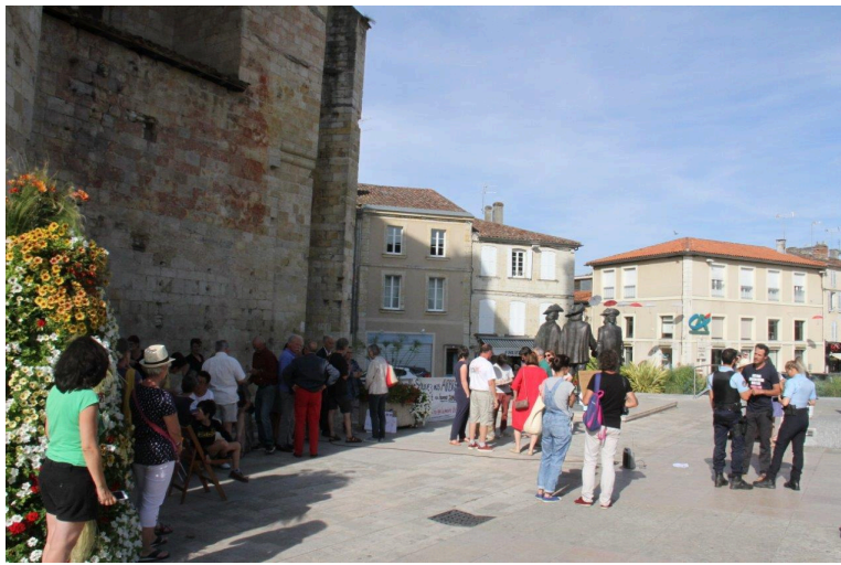
Discussion sans conséquence avec les policiers municipaux ...