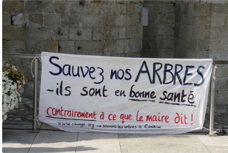
Les Amis des arbres toujours mobilisés

Nouvelle réunion d'information pour ce jeudi