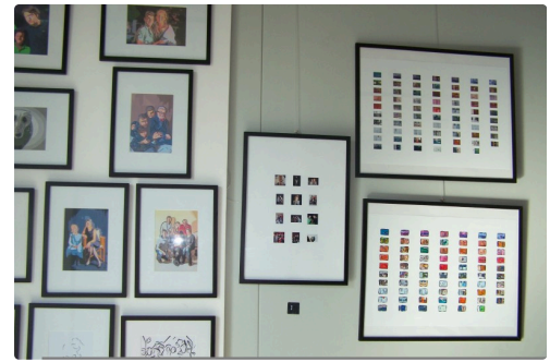
Les peintures-photos de Jean-Baptiste Tournay