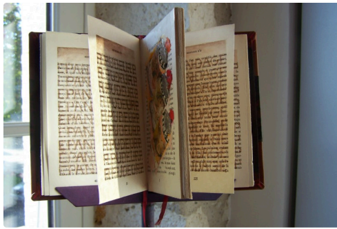
Le livre "Pudeur" de Gérard Puiset