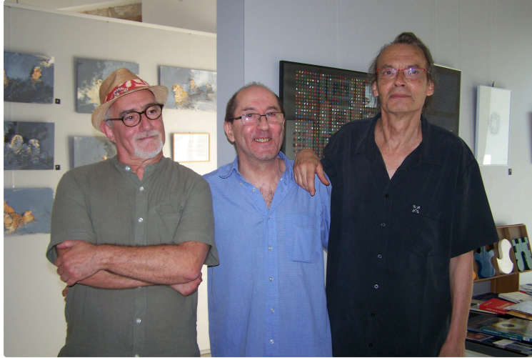
Vernissage d'une exposition épatante de quatre artistes à la médiathèque